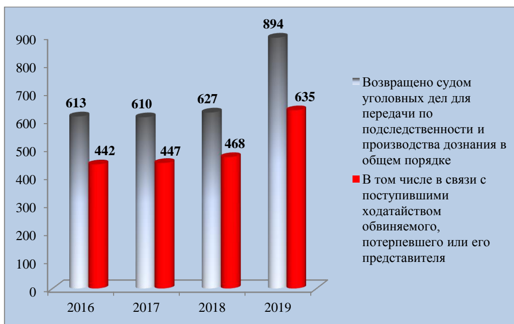
Рис. 2. Статистические сведения о возвращенных уголовных делах судом прокурору для передачи по подследственности и производства дознания в общем порядке

- статистическими сведениями, из анализа которых прослеживается тенденция роста количества возвращенных судом уголовных дел для передачи по подследственности и производства дознания в общем порядке, из которых порядка 70 % возвращаются по причине заявления обвиняемым, подсудимым, потерпевшим или его представителем ходатайства о производстве дознания в общем порядке, что отражено на рис. 2 1 .